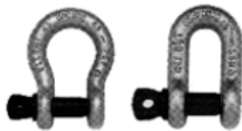
Ω - Schäkel D - Schäkel

Hinweis: Die Form und Größe der Schäkkel: